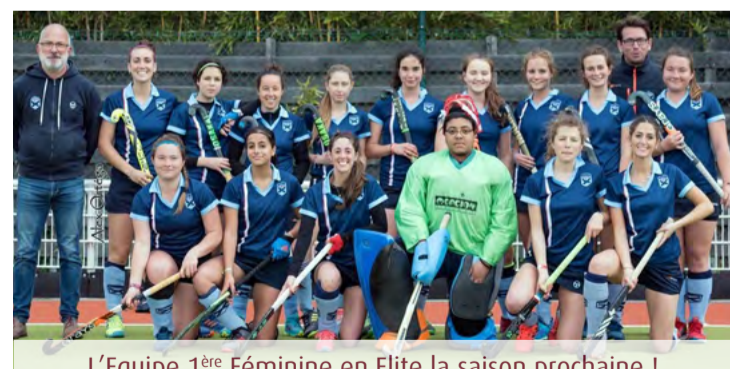
L'Equipe 1 ère Féminine en Elite la saison prochaine !

La saison dernière, elles luttèrent pour se maintenir - cette saison, elles accèdent à l'élite française.