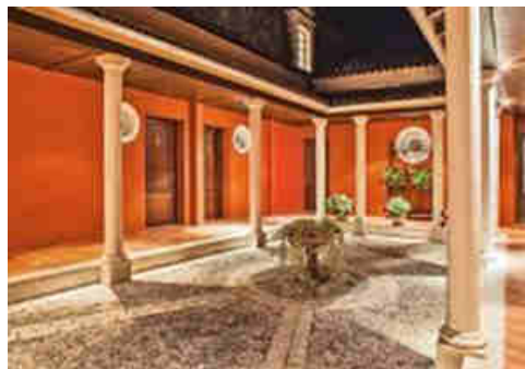
Le patio du Château