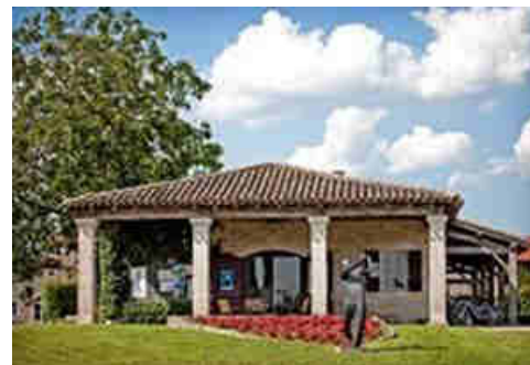
Caddy Master - Golf