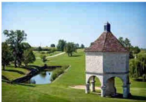
Le Pigeonnier devant le Château