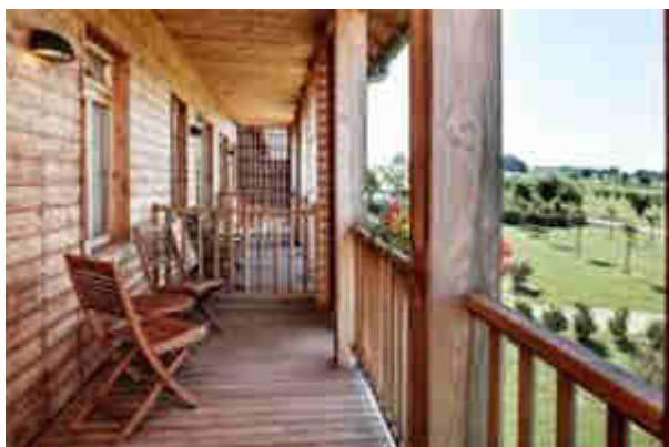
Balcon Chambre Supérieure Relais

Le Relais des Vigiers est empreint de tradition (architecture des séchoirs à tabac d'autrefois), ce bâtiment de bois aux normes HQE a été construit avec des produits nobles et locaux. Le lieu n'est qu'harmonie au cœur de la nature. Les chambres sont très spacieuses avec balcon ou terrasse (36m 2 par chambre).