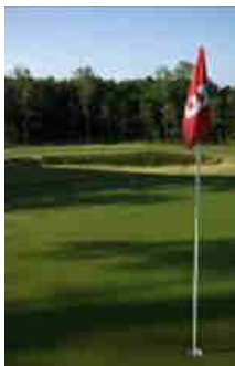
27 trous de golf