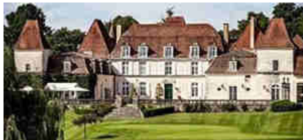
Le Château des Vigiers