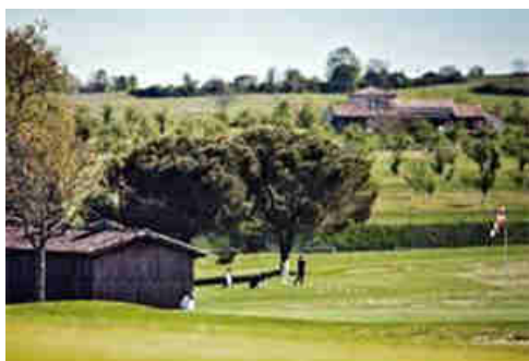
Practice du Golf